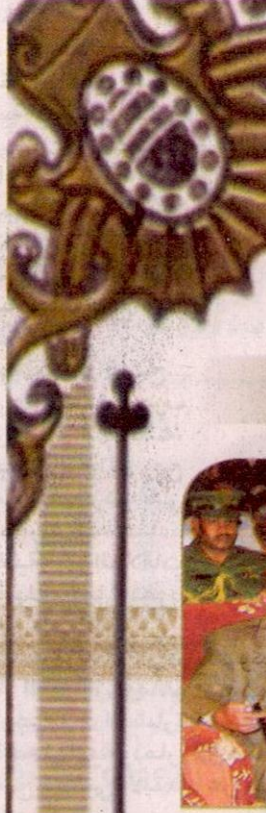
شروع التمدد ( لى كاول مدرسة

عقب القرار الذي أصدرته الهيئة القومية للاتصالات العام الماضي حول تحديد مبلغ محدد لتحويل الرصيد في اليوم، الأمر الذي أدى إلى تدمير العديد من المواطنين جراء